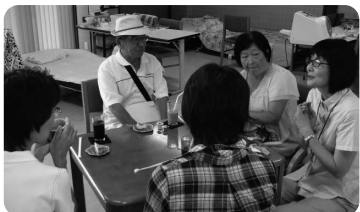
さわやかタウンの2階で懇親会