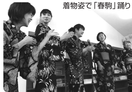
着物姿で「春駒」踊り

100歳を迎えられたご利用者様のご誕生日会にケアマネ全員で「春駒」を踊りお祝い致しました。また機会があれば呼んで下さいね。(ケアマネ一同)