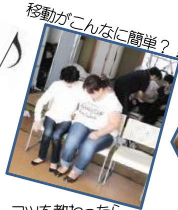
移動がこんなに簡単?! コツを教わったら私にもできた♡