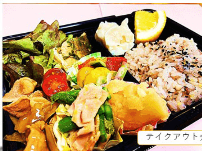
テイクアウト弁当