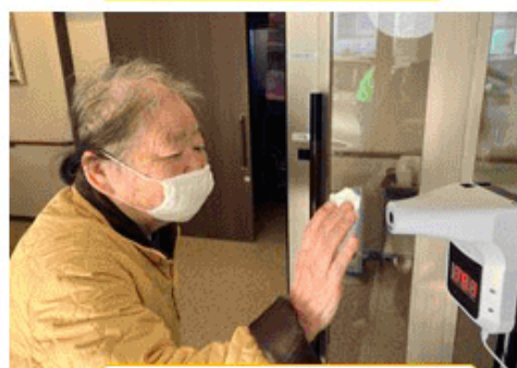
玄関の非接触型体温計