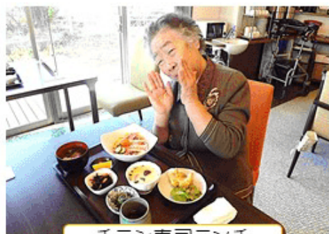
チラシ寿司ランチ

終息がみえない厳しい状況の中、消毒やマスクの着用など感染予防の大切さを感じる日々。 デイサービスのご利用者様は、マスク着用、消毒や検温に積極的に取り組んでくださっています。